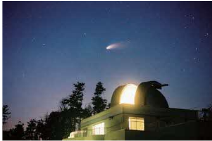
宇根山天文台上空で撮影されたハールホップ彗星(1997年)

図三原市宇根山天文台 図18:00~22:00 図一般310円 中・高生210円 小学生100円 ☎開館時 0847-32-7145(宇根山天文台) 開館時 080-8230-8701(宇根山活性化グループ) 開館はHPでご確認ください 図あり 図三原久井ICから車で約20分