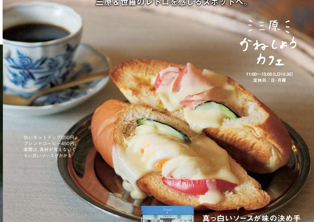
白いホットドッグ650円、ブレンドコーヒー450円。実際は、具材が見えないくらい白いソースがかかる