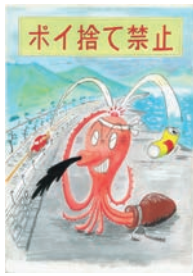
石黒楓乃(宮浦中3年)作