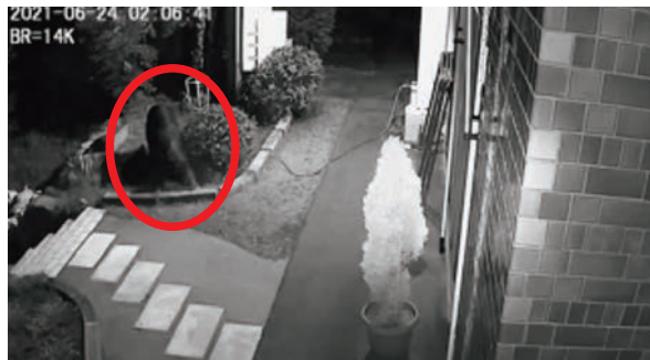
◀ 深夜に民家の花壇を荒らしに来ることも

全国のイノシシの数は約87万頭で、減少傾向にあるものの、1990年代の約3倍の数です。ここ数年、市役所周辺やJR三原駅周辺、商業施設の駐車場、県立広島大学など市中心部での目撃が相次いでいます。