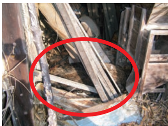
▶ 納屋を隠れ家として休憩しているイノシシ

残飯などのゴミや庭の放置果樹など、市街地には餌となるものがたくさんあります。「人間は怖くない」と学習したイノシシは餌を求めて現れます。柵などの対策をしていない庭や畑に野菜や果物を放置していることは「餌付け」していることと同じです。管理されていない空き家や茂み、草むらは、イノシシの格好の隠れ家です。