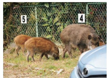
▲ 慣れてしまえば車も怖がりません