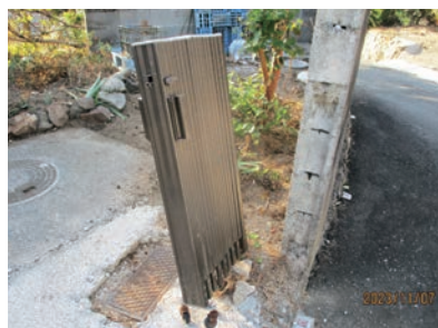
▲ イノシシがぶつかり、曲がってしまった門扉