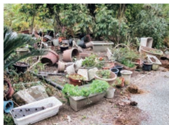
◀ イノシシに荒らされたプランター 人家や畑を荒らす行為を繰り返すことも