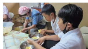
↑みかんジャム作り