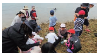
↑アマモ場再生プロジェクト