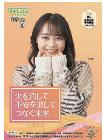
↑ 秋の全国火災予防運動 ポスター