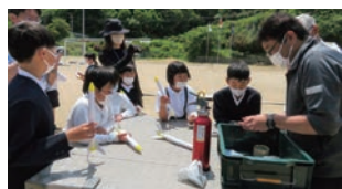
↑匠から学ぶものづくり