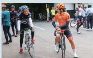
▲秋晴れの空の下、サイクリングを楽しむ参加者 ▲イベントでは参加者とヴィクトワール広島選手たちも交流

秋の景色を楽しみながら行う「2023フルーツライドみはら秋のサイクリング」が開催され、市内外から338人が参加しました。当日はプロ自転車ロードレースチーム・ヴィクトワール広島選手らも参加しイベントを盛り上げたほか、市内産のブドウやミカン、市内企業から提供されたスイーツなどがふるまわれ、参加者は食とスポーツの秋を楽しみました。