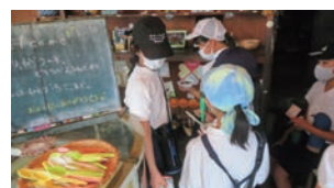
↑お店番ふれあい活動