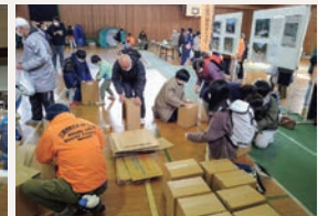
↑段ボールベッドの組立体験