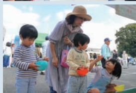
▲大和小学校の6年生が太鼓演奏を披露 ▲露店でスーパーボールすくいを楽しむ親子

大和支所周辺で「2023だいわ元気まつり」が開催されました。特設ステージでは神楽団や太鼓、踊り、民謡などの発表が行われ、祭りを盛り上げました。また、地元の皆さんによる飲食物の販売や町内で採れた野菜などをふんだんに使った「大和まるごと鍋」が無料でふるまわれ、訪れた人たちは、大和産の食材に舌鼓を打ちました。