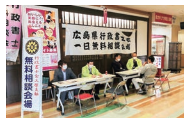
↑昨年の相談会の様子