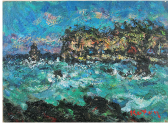
秦森康屯 「男鹿風景」