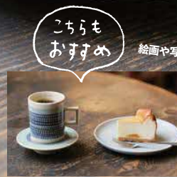
こちらもおすすめ