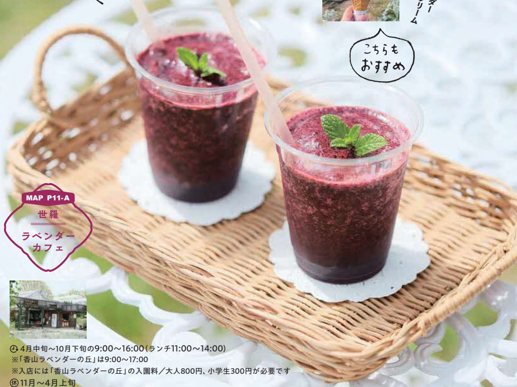
「ラベンダーカフェ」の ブルーベリースムージー 500円