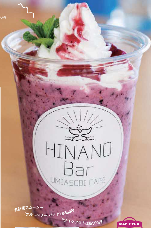
自然薯スムージー (ブルーベリー、バナナ)各550円 ※テイクアウトは各500円