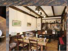
絵画や写真など、壁の展示は1か月ごとに変わる

ブレンドコーヒー460円、ペイクドチーズケーキ460円 ※セットで注文すると100円引きに