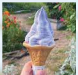
ソフトクリーム 400円