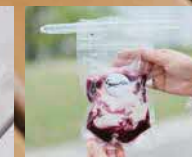
スムージー(ブルーベリー)500円