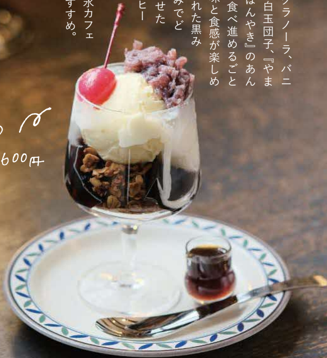
「カフェロンド」の ミニパフェ 600円

トミールグラノーラ、バナラアイス、白玉団子、『やまこを重ね、食べ進める。ことに異なる味と食感が楽しめる。添えられた黒みつはお好みでどうぞ。凍らせたアイスコーヒーに冷たい牛乳を注いで飲む「氷カフェオレ」もおすすめ。