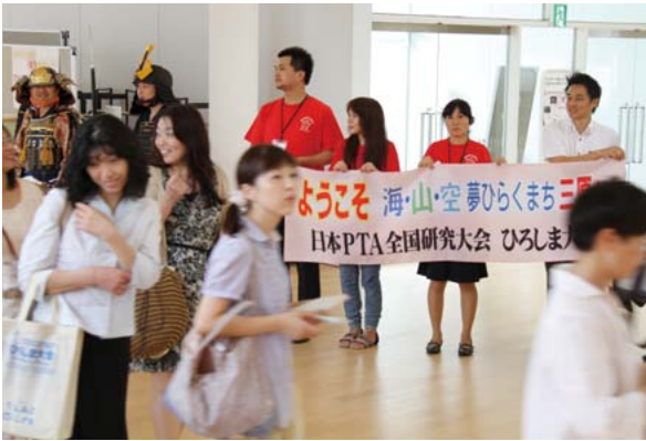
▲横断幕を掲げて参加者を出迎えました

いずれの行事も、市外・県外から多くの来訪者があり、横断幕を掲げて出迎えるとともに、市内の飲食店や宿泊施設などで割引を受けることができるガイドブックや、観光パンフレットなど