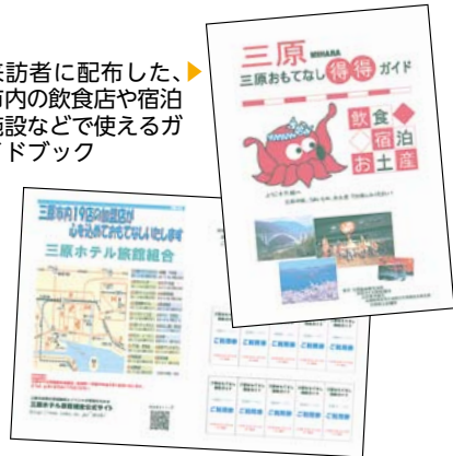
▶来訪者に配布した、市内の飲食店や宿泊施設などで使えるガイドブック

を配布しました。今後、市のPRや交流人口の増加、観光振興などに結び付くよう積極的に取り組んでいきます。