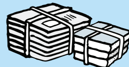
新聞・雑誌・雑がみ