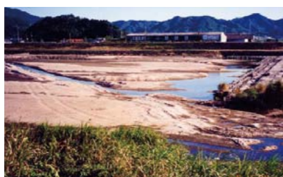
▲渇水時の沼田川(平成6年8月)

西野浄水場内には自家発電設備を設置し、主要な管路には耐震管を採用しています。また、大規模な貯水タンク