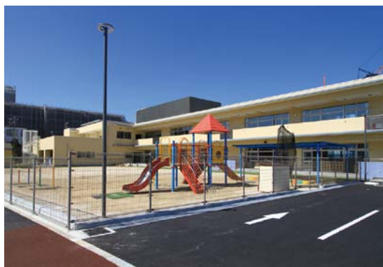
▲建物をL字型に配置し、自然光を採り入れる設計としました

円一保育所は、2階建ての保育所棟、地域子育て支援センター、病児保育室棟などで構成しています。敷地面積は約3,500㎡、屋上部分を含む延床面