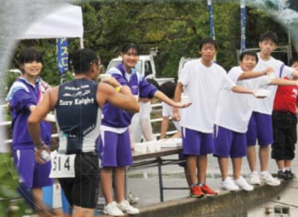
佐木島を舞台に441人が鉄人レースに挑戦。あいにくの荒天の中、多くの観客やボランティアからの声援が選手を勇気づけました(8/25 トライアスロンさぎしま大会)