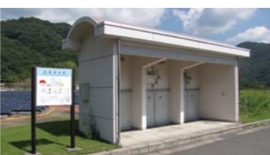
▲応急給水所(西野浄水場内)

事業の経営状態をみると、人口減少や節水機器の普及などで、水道の料金収入は減少傾向が続いています。今後、設備投資などに必要な資金を確保するため、長期的な視点に立ち、事業の効率化や経費の節減を進めていきます。市民の生活を支える水。これまでも、そしてこれからも、安心・安全で良質な水道水を、安定的に供給できるように取り組んでいきます。