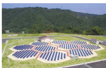
▲太陽光発電システム「太陽の花」

ほかに、太陽光発電システム、電気自動車を導入し、環境にやさしい取り組みを行なっています。