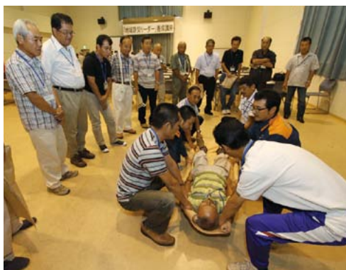
▲消防士から毛布を使った簡易担架のつくり方を学ぶ参加者

講座は、地域における防災活動で指導的な役割を担う防災リーダーを養成し、自主防災組織や町内会などでより効果的に活動してもらうことを目的としています。2日間で、災害時の防災リーダーの心構え、気象情報などを正しく理解する方法についての専門家の講演のほか、消防士を講師にしたロープの結び方、毛布を使った簡易担架づくりなどの実技指導、普通救命講習、