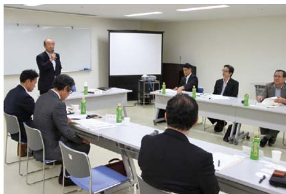
▲今後、3つの部会に分かれ、行財政改革やまちづくりについて検討します

会議は、今月から月1回程度開催し、年度内に具体的な方向性をまとめ、市長に意見を提出する予定です。