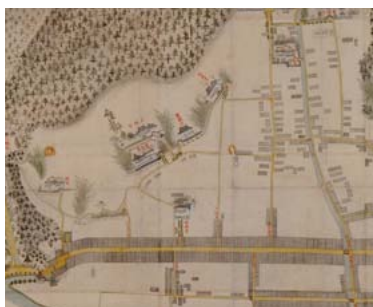
▲1709年(宝永6年)の三原西町絵図の一部