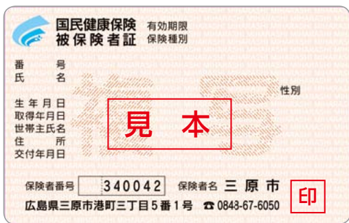
▲新しい保険証(見本)

今月1日から、国保の保険証が新しくなります。医療機関などで受診する場合は、必ず新しい保険証を提示してください。有効期限は来年9月30日まで。