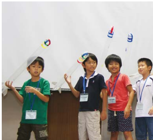
▲親子でかさ袋ロケット作り。羽の位置や重りの量を変えて飛び方を研究しました(9/7 宇宙の学校 久井保健福祉センター)