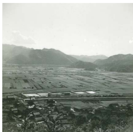
▶昭和32年当時の宮浦浄水場(写真中央下)

市の上水道は、中之町の和久原川付近に水を取るための井戸を、館町の椋山に貯水タンクを建設し、昭和8年10月26日に給水を開始しました。最初の給水地域は現在の東町と館町でした。当時の三原町の人口は12,822人(昭和5年国勢調査)。建設費は9万9千円でした。この設備投資は当時と