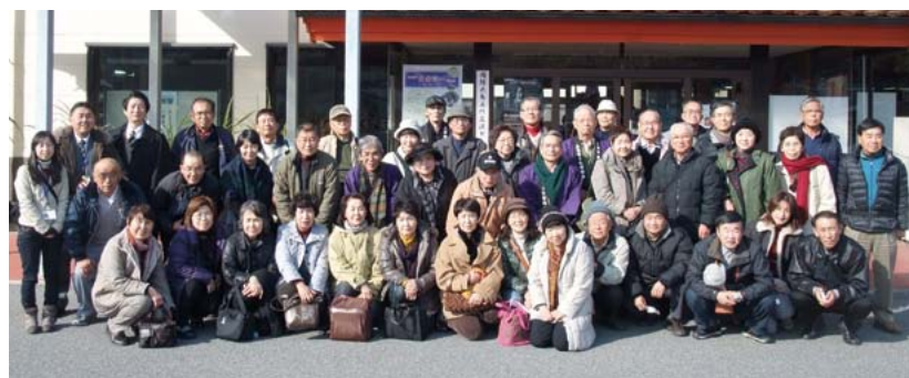
▲私たち市民学芸員が、このページに楽しい情報を届けます