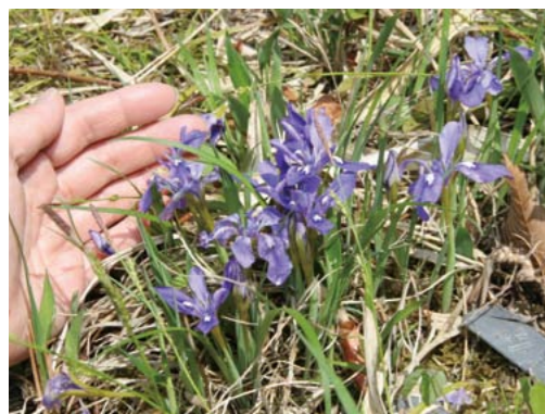
▲高さ15~25cmのエヒメアヤメ