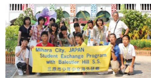
▲昨年度の参加者のようす