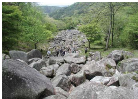
▲川や海のように岩が並び、「ごろごろ」とも呼ばれる岩海