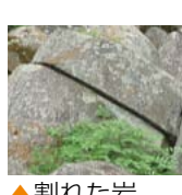
▲割れた岩 ▲表面がはがれ そうな岩

「熱や水、空気などが岩 に当たって、長い年月の うちにひびが入ったり、欠けた りすることだよ。最後は『真砂 土』という砂になるんだよ。」