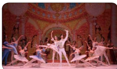
▲ねむれる森の美女

ところ ホール 入場料 A席3,000円 ※S席は完売しました。 ※4歳から入場できます。 販売場所 ポポロ、うきしろロビー、フジグラン三原ほか