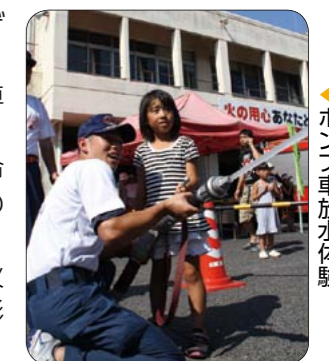
▶ポンプ車放水体験

ところ リージョンプラザ 内容 ▶体験コーナー:ポンプ車放水、ロープ渡りなど ▶学習コーナー:救急救命(AED)講習、消火器の取り扱いなど ▶ふれあいコーナー:防火サイコロ、記念写真撮影など 消防本部予防課(☎0848・64・5927)