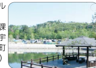
▲宇根山家族旅行村

施設 オートサイト(車を横付けしてテントが張れます)=34区画、デイサイト(バーベキューかまど付き日帰りキャンプ用)=30区画 利用料 1,050円/日(1泊2日2,100円) ※キャンプ用具のレンタルもあります。 申し込み先 青少年女性課(☎0848・64・9234)、宇根山家族旅行村(久井町吉田☎0847・32・7891)