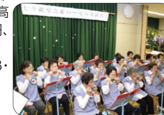
▲ハーモニカコンサート

ところ 宇根山天文台(久井町吉田) 内容 織り姫(ベガ)・ひこ星(アルタイル)の観望、ハーモニカの演奏会(19時~) 入館料 大人310円、中高生210円、小学生100円、小学生未満 無料 青少年女性課(☎0848・64・9234)