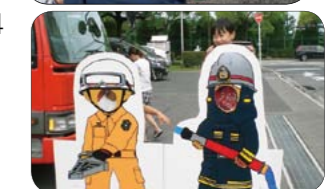
▲記念撮影コーナー