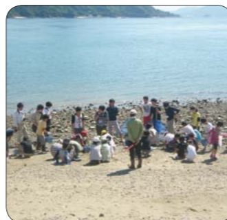
▲海辺の生き物などを観察

申し込み 10日(水)必着までに、住所、名前、学年、電話番号をはがき、ファクスまたはEメールで生活環境課(〒723-8601港町三丁目5番1号☎0848・67・6194 ☎0848・67・6199 seikatsukankyo@city.mihara.hiroshima.jp)へ