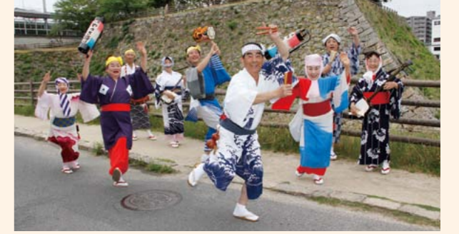
▲昔風やっさ踊りのようす

とき 1日(木)~23日(金)10時~18時 ※9日(金)~11日(日)は17時まで。 ところ 市民ギャラリー(ペアシティ三原西館2階) 内容 やっさ踊りの歴史、古写真やグッズの展示 入場料 無料