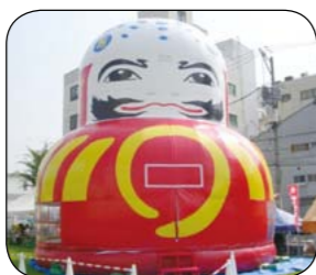
▲やっさ祭りでデビューした「ミハラッキー」

内容 やっさ祭りでお披露目された三原だるまの形をしたふわふわドーム。愛称も「ミハラッキー」に決定し、三原の新たなシンボルになりました。思いっきり飛んで、楽しく跳ねて、元気な子どもに福きたる!