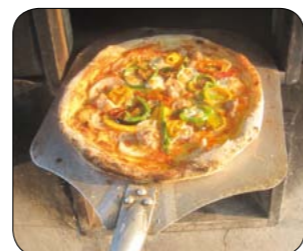
▲焼きたての石窯焼きピザ

内容 イタリア料理をベースに、大和れんこんやはと麦、桃など地元の特産品を使った特色のある料理を楽しめるレストランになります。好評の石窯焼きピザ、包み焼きそば、はと麦ソフトクリームも引き続き提供