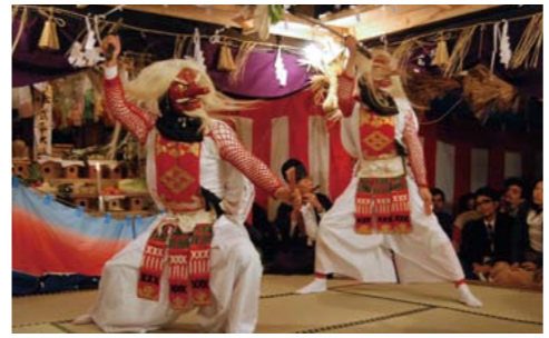
▲比婆荒神神楽保存会による「猿田彦の舞」

●記念公演 とき 9月16日(月・祝) 14時～17時 ところ リージョンプラザ 文化ホール 内容 重要無形民俗文化財に指定されている比婆荒神神楽保存会による神楽の披露 定員 400人(先着順) 入場料 1,000円 販売場所 中央公民館