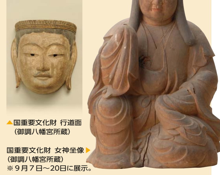
▲国重要文化財 行道面(御調八幡宮所蔵) 国重要文化財 女神坐像(御調八幡宮所蔵) ※9月7日～20日に展示。