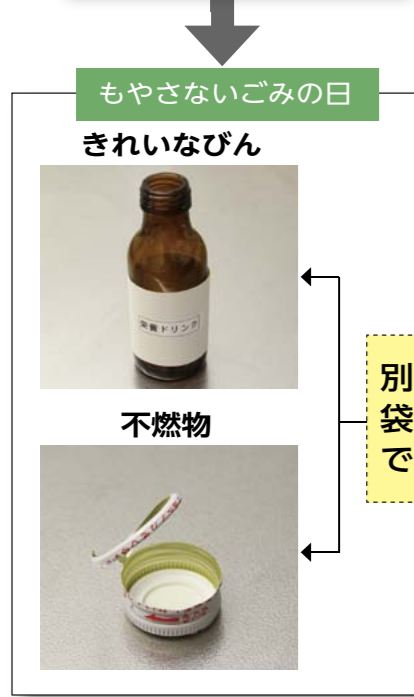
例:栄養ドリンクのびん