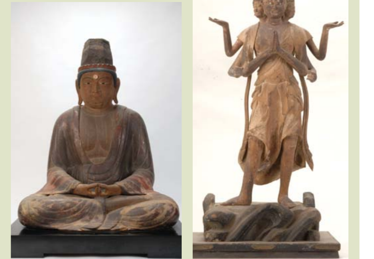
▲県重要文化財 宝冠阿弥陀仏坐像(尾原相談会) ▲県重要文化財 二十八部衆立像(阿修羅王)(棲真寺所蔵)