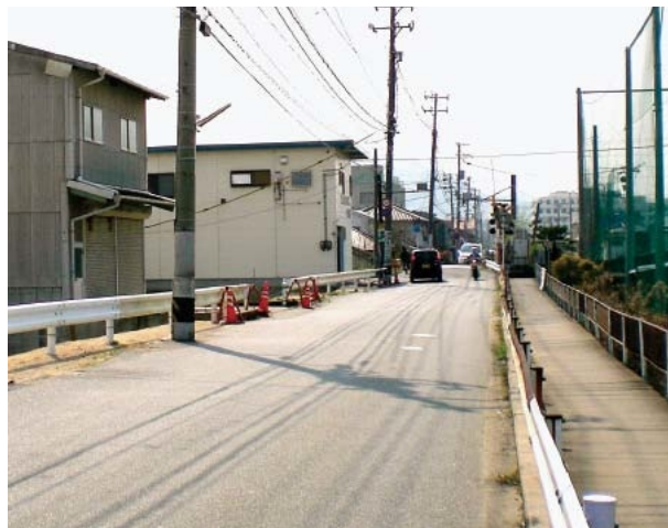
▲整備前の呉線羽仁踏切