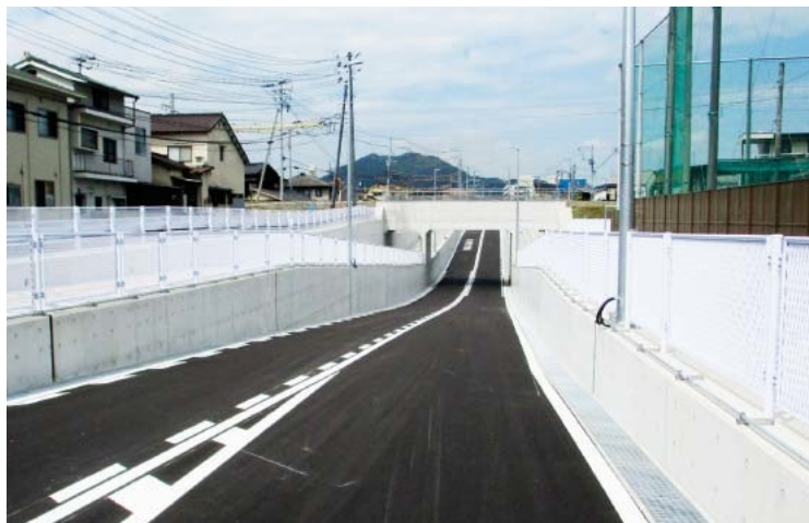
▲完成した立体交差(三原高等学校グラウンド南側)